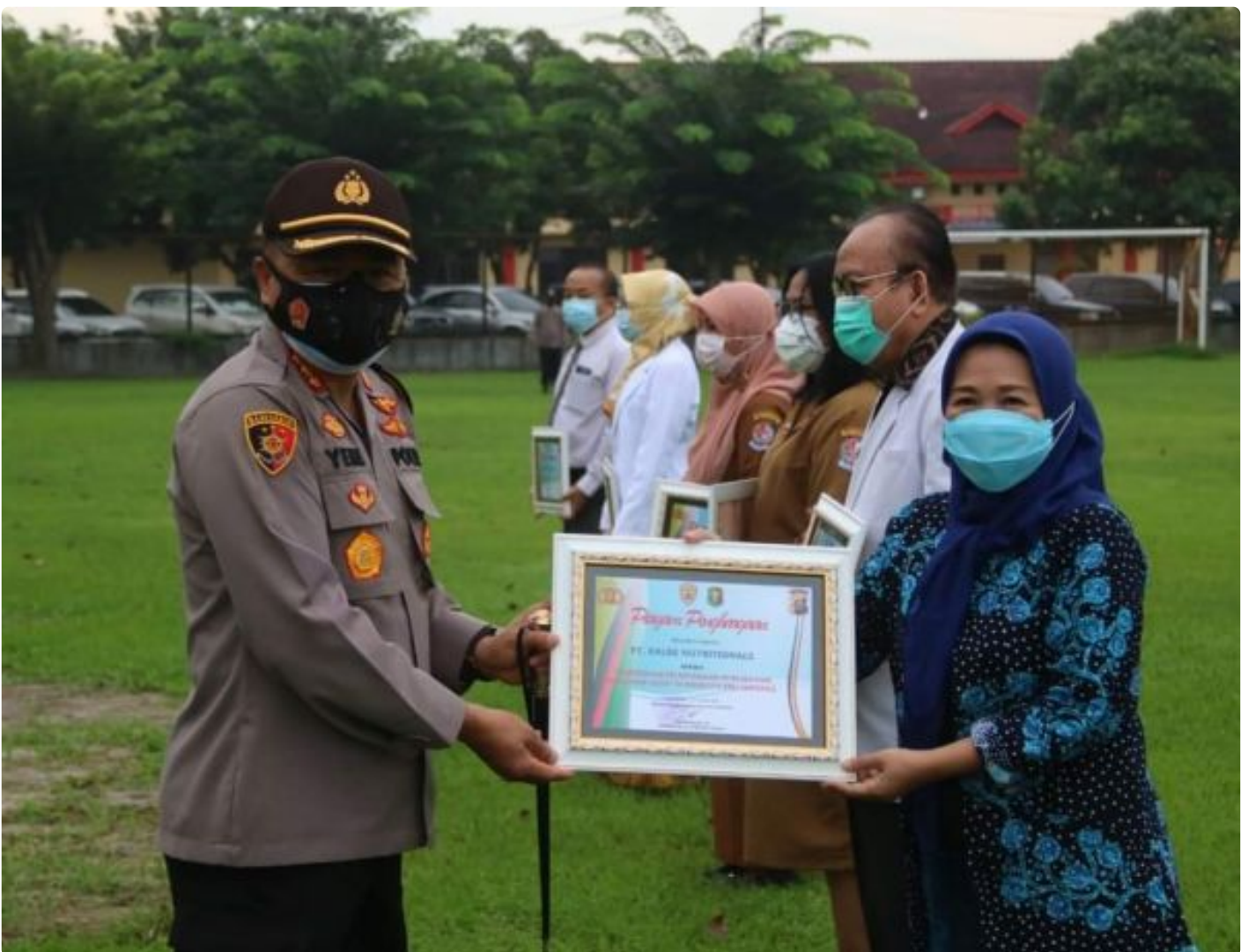
Kapolresta Deli Serdang Berikan Piagam Penghargaan Kepada Tim Medis